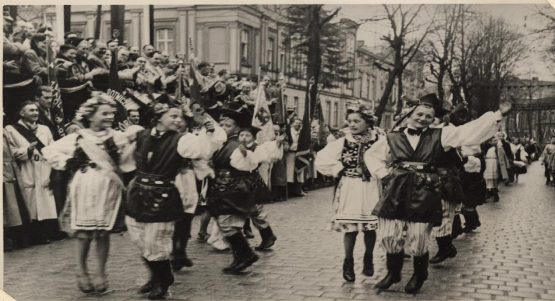
Zespół taneczny - Kwadrówka zespół trybunów.