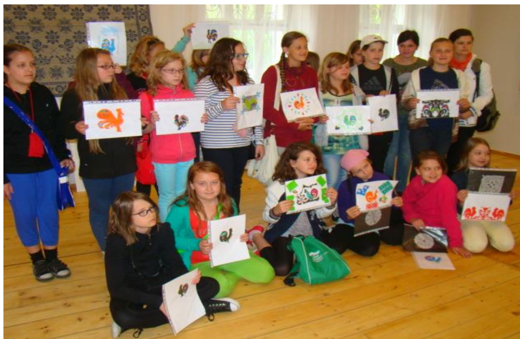
Polsko-niemieckie spotkania młodzieży na obozach w Przylepie.

Na przestrzeni ostatnich kilkunastu lat realizowaliśmy międzynarodowe projekty wspólnie ze szkołami z Finlandii, Francji, Irlandii, Grecji, Włoch, Rumunii, Szwecji, Walii, Łotwy i Węgier. Szczególnie ważne i rozwijające są dla nas kontakty z wieloletnim partnerem – Niemcami i szkołą w Cottbus, z którą Szkoła Podstawowa nr 1 podpisała deklarację współpracy w 1999 roku.